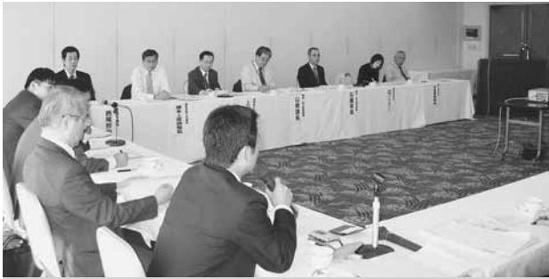
建設産業への人材確保をテーマに行政、業界が意見交換＝松江市内

する高校生を対象とした現場見学や現場実習のほか、建設産業の仕事の内容や魅力をアピールしたガイドブックを配布するなどPRし、新卒者の獲得に努力しているが、「地方では公共事業費の削減の影響で新規の採用がとてできない状況にある」と訴えた。これらの状況を踏まえ、本業以外の分野での人材確保を求める意見もあった。