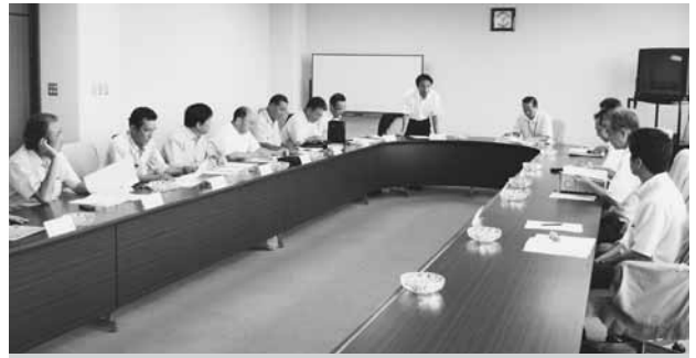
建設産業対策などをテーマに活発に意見交換する建協浜田支部と県土木部担当者ら＝浜田建設会館

化しており下位ランクの受注機会が少ない」など課題を指摘。業界を取り巻く環境が経営状況を圧迫しており、工事受注機会や雇用問題など県の早急な対応を求める意見や要望が相次いだ。