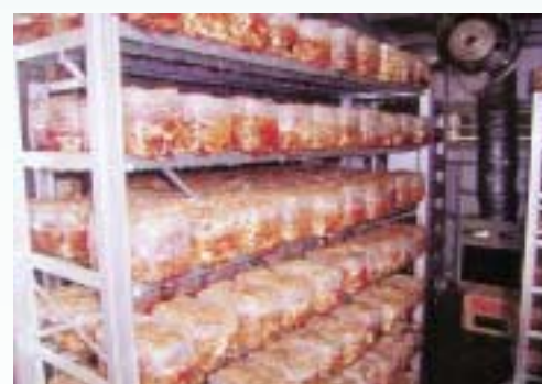
工場内部(椎茸菌床)

5月の連休頃から椎茸が取れ始め、段取りよく量が増大すると思いきや、湿度・温度の調整、明かりの調整となかなか思うように運ばず、悪戦苦闘の毎日でした。それでも昨年2月の菌床搬入から1年が過ぎ、暑さ・寒さも1回ずつ経験したことで、少しずつですが要領もつかめてきました。これからもっと頑張って良い椎茸にしたいと思います。