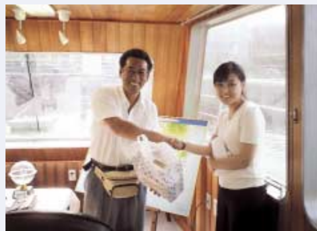
平成17年7月25日 研修先の釜山貿易会館職員の方と

最後になりましたが、我々青年部会を支えていただいております支部長をはじめ親会の皆様方と協会支部の職員の方々に心から感謝の意を表し、巻頭の挨拶とさせていただきます。本当にありがとうございました。