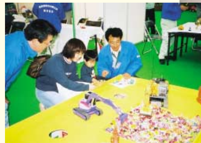
平成14年11月1日 “しまね建設技術展2002”での一コマ