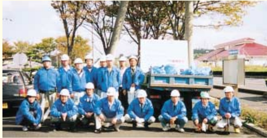
平成11年11月18日 “土木の日”ルート9クリーンアップ作戦にて（後列右端）