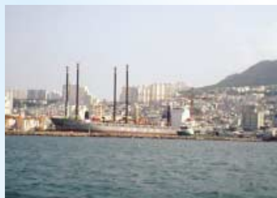
海から見た釜山市内

高速船は玄界灘をすべるように北上し、対馬を越えるとすぐに朝鮮半島の山並みが浮かび上がってきました。到着までの所用時間は僅か2時間55分。本当に近いお隣の国であります。（博多から釜山へ行くまでの時間よりも、バスでの出雲～博多間の方がよっぽど長く、疲れしました。）本日のホテル到着は夕刻となり、焼肉での夕食を終えると疲れはもうピー