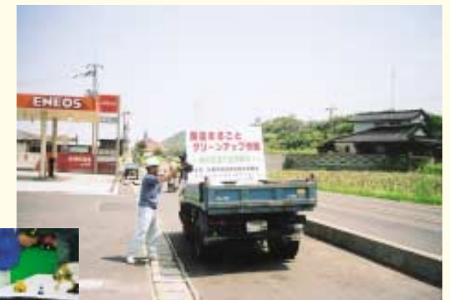
平成16年7月28日 “国道まるごとクリーンアップ作戦”