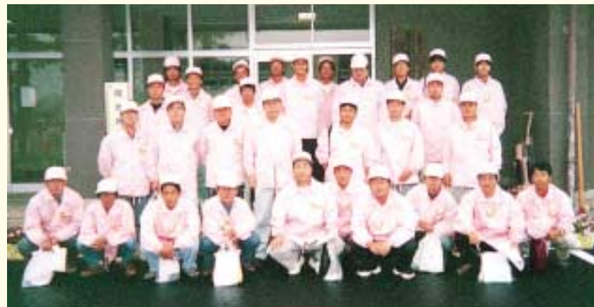
平成11年10月3日 「ゆうあいピック」にボランティア参加（後列右から5番目）