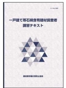
一戸建て等石綿含有建材調査者講習テキスト

※ 石綿作業主任者技能講習修了者は、一般および一戸建て等の両講習とも、科目「建築物石綿含有建材調査に関する基礎知識 1」（1 時間）が免除されます。