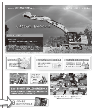
島根県建設業協会ホームページ