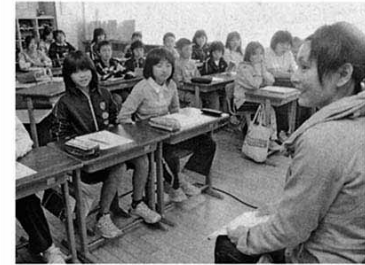
母親から妊娠時の様子を聞く5年生の児童

「産んでくれてありがとう」と。田子町立田子小学校（佐々木校長）で十七日、五年生の母親が、妊娠時の思い出を子供たちに語る授業が行われた。自分が生まれてくる時の様子聞いた児童たちは涙を流して、両親に感謝の言葉を伝えた。