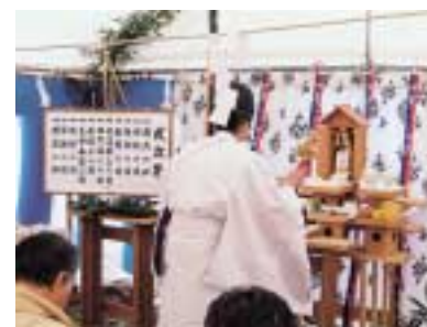
平成17年3月25日 地鎮祭