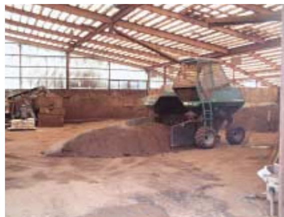
マザーソイルの工場