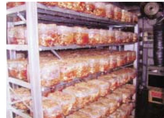
工場内部(椎茸菌床)

何分農業の経験がないものばかり、正に生まれたばかりの赤ちゃんです。頑張って頑張って、いろいろ経験を積んでおいしい野菜を作っていきたいと思います。