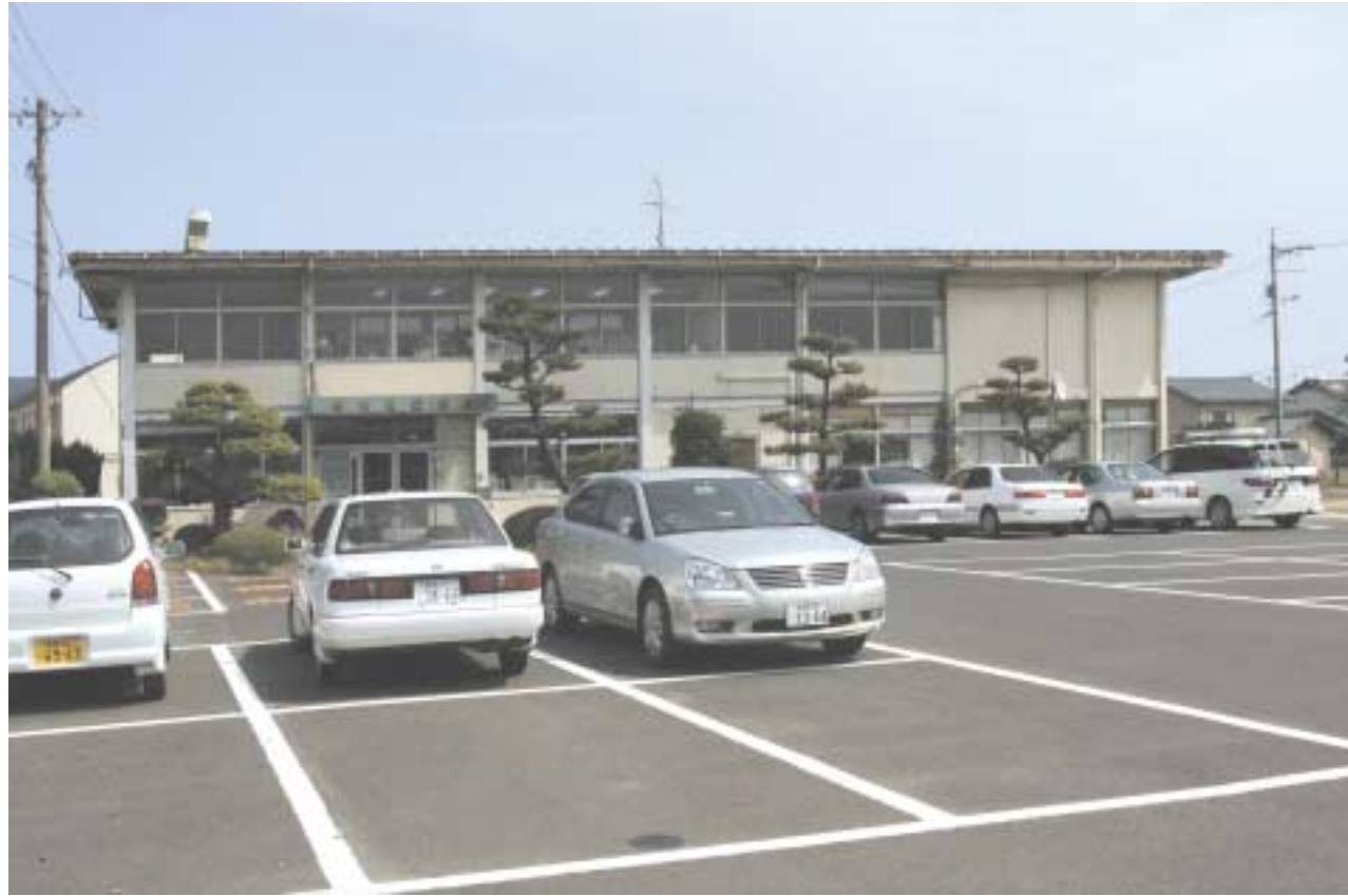
—表紙写真— (株)出雲建設会館

昭和41年5月に建った、現在の(株)出雲建設会館の全景です。 この度の移転に伴い、慣れ親しんだこの建物も解体されるこ とから、今回の表紙に載せました。